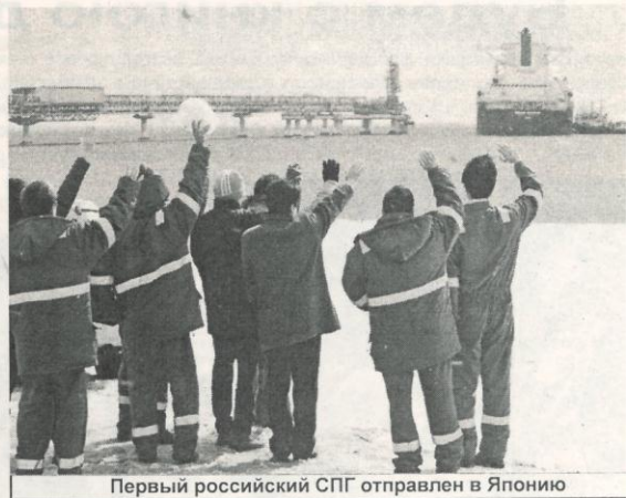
Первый российский СПГ отправлен в Японию