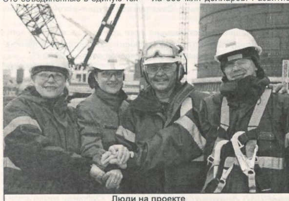
Люди на проекте